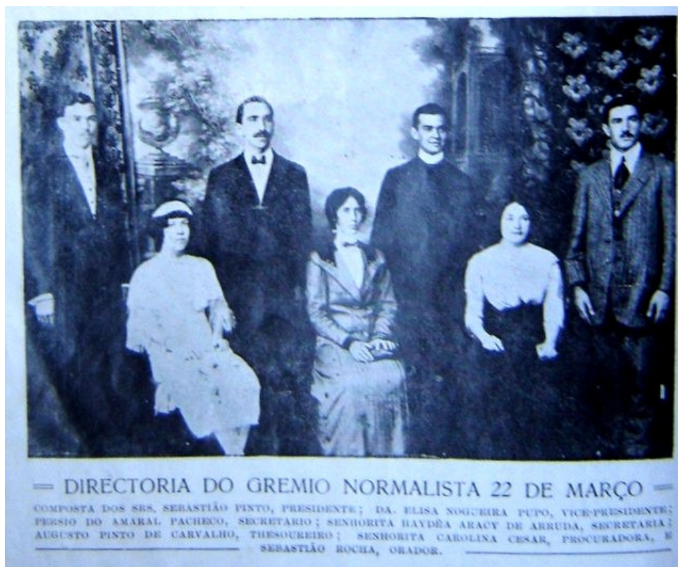
Figura 4: diretoria do Grêmio Normalista “Vinte e Dois de Março”

na revista, devido à grande afluência de colaborações, são pedidas desculpas, pois muitos artigos deixaram de ser publicados.