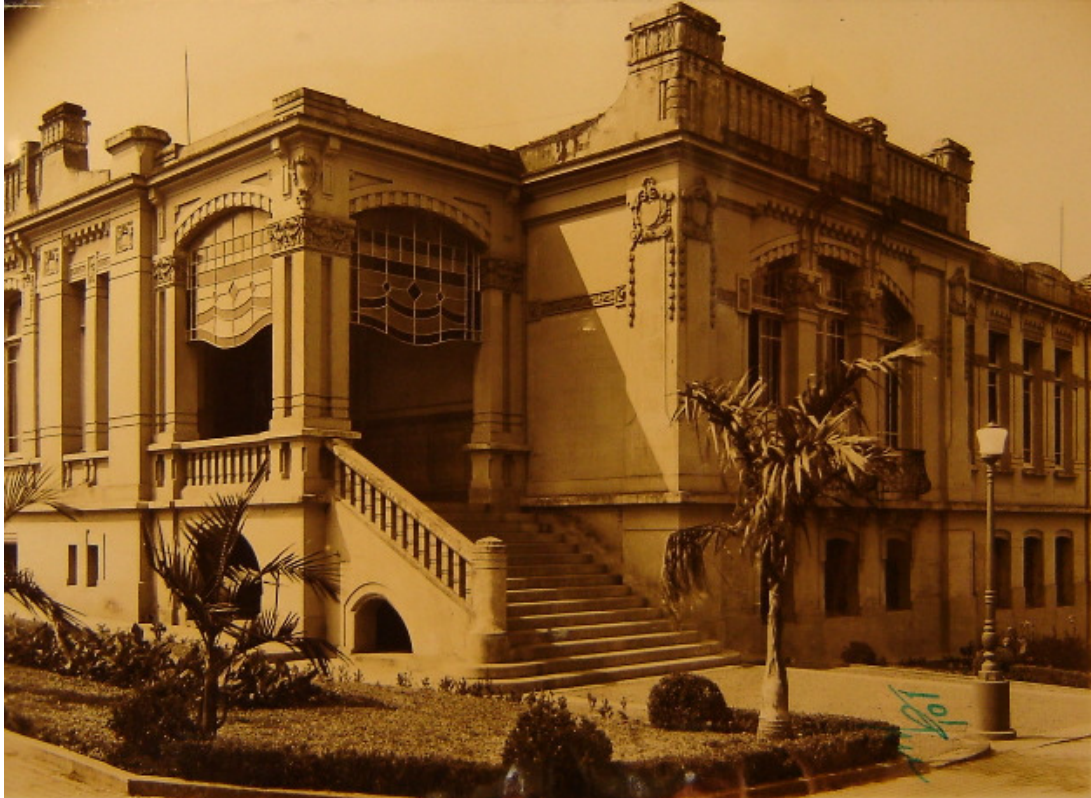
Figura 1: Escola Normal de São Carlos na rua José Bonifácio, onde ficou instalada de 1911 a 1916

A Escola Normal Secundária de São Carlos é criada com um currículo encarregado de formar um profissional imbuído dos valores republicanos, com a maior parte das disciplinas voltadas para a cultura geral, letras e ciências modernas. A formação pedagógica ficava por conta das disciplinas de Psicologia, Didática e, principalmente, a observação na Escola Modelo Anexa.