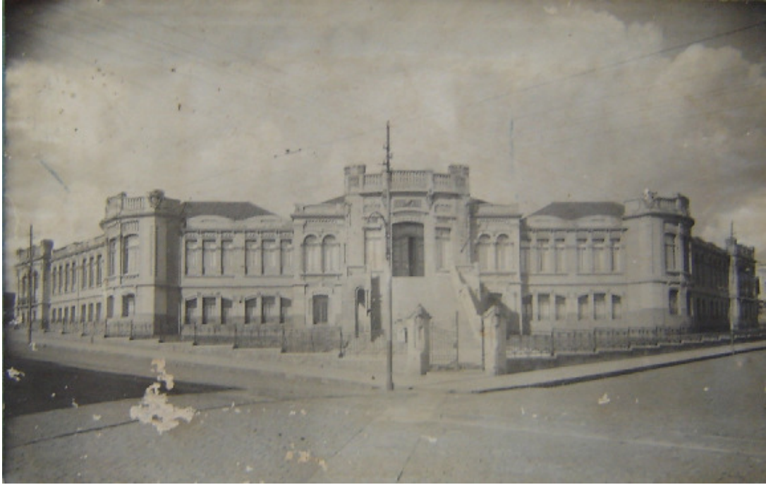
Figura 2: Prédio da Escola Normal Secundária de São Carlos na rua São Carlos, inaugurado em agosto de 1916

A primeira aula ocorreu no dia 22 de março de 1911, com um total de 62 alunos: 20 da seção masculina e 42 da feminina. As primeiras três turmas formadas pela Escola Normal Secundária de São Carlos datam de 1914, quando formaram-se 27 alunas e 7 alunos; de 1915, 31 alunas e 9 alunos; e 1916 quando formaram-se 27 alunas e 10 alunos.