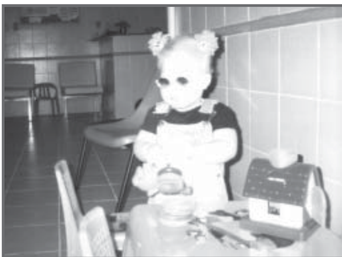
Centro de Intervenção Precoce (CIP) - Salvador, BA.

O trabalho integrado com as áreas da saúde e ação social é prioritário para a aquisição de órteses, próteses e equipamentos específicos.