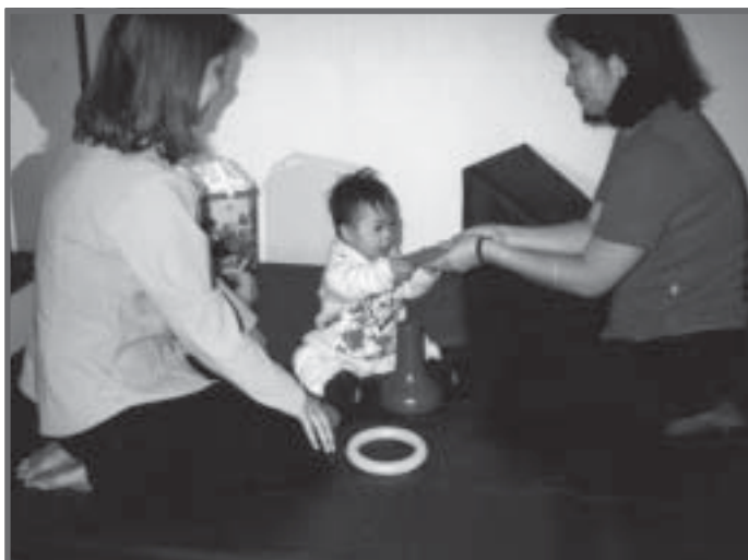
Programa de intervenção precoce. (CEES – Centro de Estudos da Ciência e da Saúde, UNESP - MARÍLIA, SP)

Os programas de intervenção precoce do nascimento aos três anos de idade são imprescindíveis para a promoção das potencialidades e aquisição de habilidades e competências. Eles devem ser, portanto, desenvolvidos em interface com os serviços de saúde, tendo em vista que essas crianças necessitam, algumas vezes, de orientação ou atendimento complementar nas áreas de fisioterapia, fonoaudiologia, terapia ocupacional e psicologia.