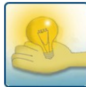
Incentivo à ciência