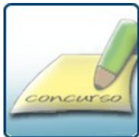
Ampliação da Rede