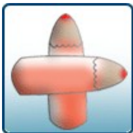
Saúde nas Escolas